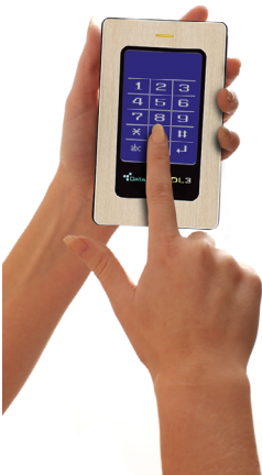
Patented touch-screen technology

Oubliez les logiciels et les pilotes complexes. Toutes les fonctions du DL3 (cryptage, administration et authentification) sont exécutées sur l'unité elle-même et gérées via une technologie d'écran tactile simple à utiliser.