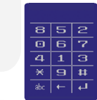
Clavier Rotatif (pour empêcher l'analyse de surface)